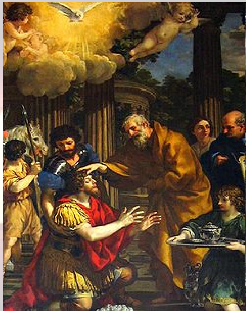
Ananias restoring the sight of Saint Paul by Pietro da Cortona