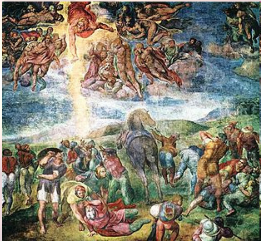
Conversion of Saint Paul, fresco by Michelangelo