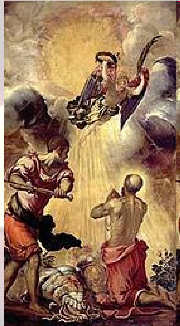
保罗受难 by Jacopo Tintoretto