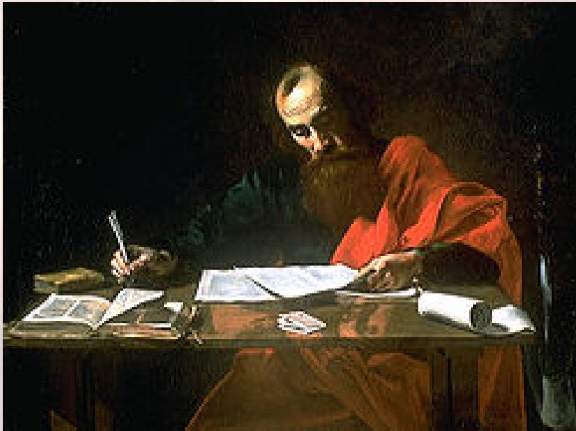
保罗：新约的主要作者