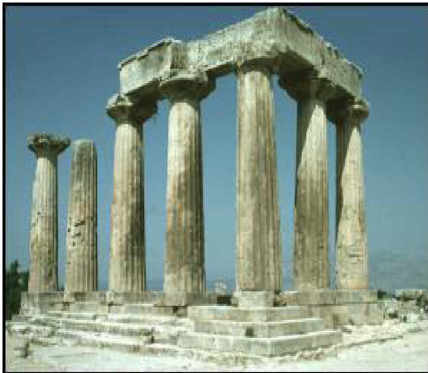
亞富羅底特女神廟